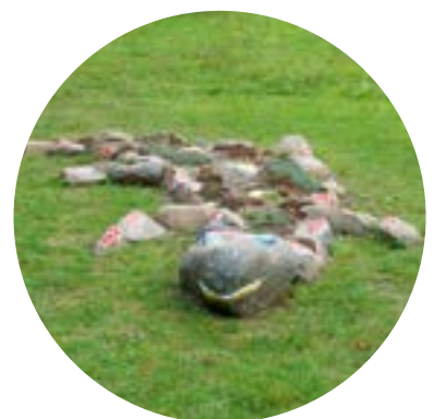
Steinkunstwerke in Reinhausen