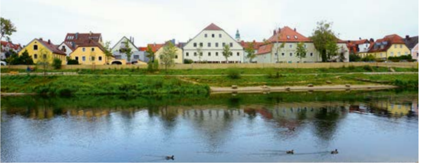
Regenufer mit Blick auf Reinhausen