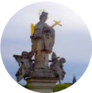
Figur des heiligen Johann Nepomuk aus dem 18. Jahrhundert

Ein weiteres Stückchen Architekturgeschichte ist außerdem in der Arberstraße zu bestaunen. Dort steht ein orange-gestrichenes TORGEBÄUDE , das zu einer Arbeitersiedlung aus der Zeit nach dem ersten Weltkrieg führt. Mit traumhaften Ausblicken auf die Skyline der Regensburger Altstadt gelangt man zu Fuß an der Donau entlang in wenigen Minuten über das angrenzende Viertel Steinweg-Pfaffenstein nach Stadtamhof. Wegen ihrer nahen Lage und der ähnlichen Archi-