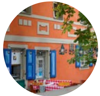
Biergarten des traditionellen Wirtshauses „Auer Bräu“